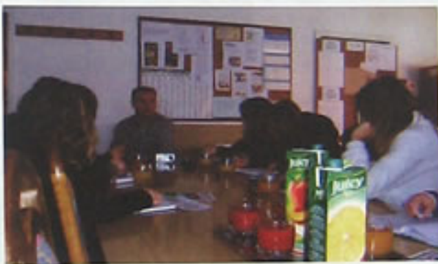
Pažljivo slušamo i bilježimo bitno ...