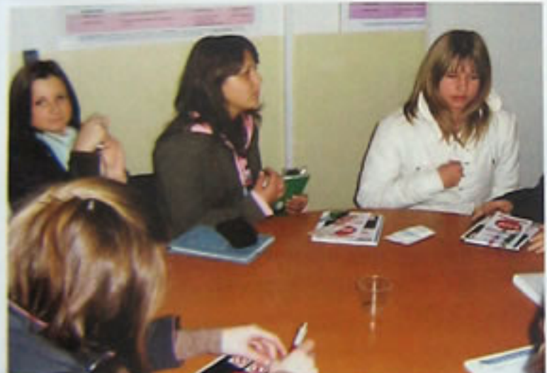
Za okruglim stolom upijamo kao spužve ...