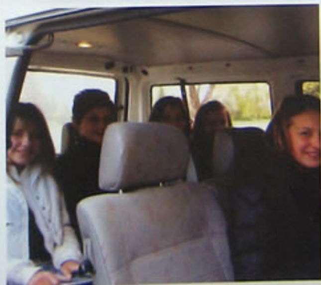
Do sljedećeg javljanja, ... bye, bye!