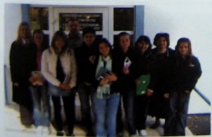
Pozdrav iz Centra !